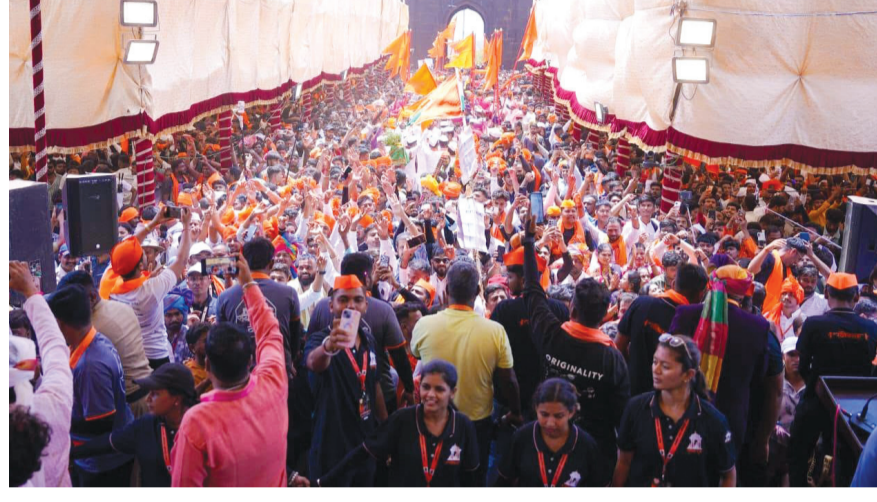
शिवभक्तांना संबोधित करतात. यंदाही संदेश दिला. यांनी उपस्थितांना भवनिक शब्दांत संभाजीराजे छत्रपती यांनी उपस्थितांच्या उत्साहाचे कौतुक केले. उपस्थितांच्या उत्साहाचे कौतुक केले. उल्लेख करताना त्यांनी, हा केवळ रायगडावर जमलेल्या जनसमुदायाचा जनसागर नाही, (पान ४ वर)

जनता आवाज वृत्तसेवा पुणे : रायगडावर काल छत्रपती शिवाजी महाराजांच्या ३५२ व्या शिवराज्याभिषेक सोहळ्याचा उत्साहपूर्ण जल्लोष पाहायला मिळाला. देशाच्या कानाकोपऱ्यातून हजारो शिवप्रेमी आणि शिवभक्त रायगडावर दाखल झाल्याने संपूर्ण परिसर शिवमय झाला होता. महाराजांच्या जयघोषाने गड दुमदुम गेला असून विविध सांस्कृतिक आणि ऐतिहासिक कार्यक्रमंचे आयोजन करण्यात आले आहे. छत्रपती शिवाजी महाराजांचा राज्याभिषेक ६ जून १६७४ रोजी याच रायगडावर पार पडला होता. या ऐतिहासिक दिवसाची आठवण जपण्यासाठी दरवर्षी संभाजीराजे छत्रपती रायगडावर उपस्थित राहून