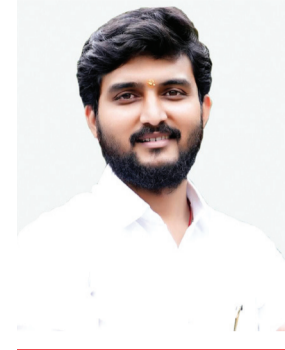
बांधितांना मदतीसाठी तहसिलदारांना सूचना