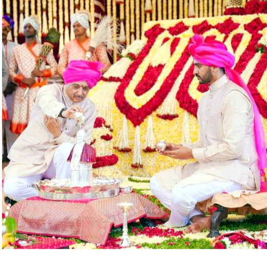
उपस्थितांच्या उत्साहाचे कौतुक केले. उल्लेख करताना त्यांनी, हा केवळ रायगडावर जमलेल्या जनसमुदायाचा जनसागर नाही, (पान ४ वर)

१९४७ मध्ये देशाला ब्रिटिश सत्तेतून स्वातंत्र्य मिळाले, हा दिवस निश्चितच ऐतिहासिक आहे. मात्र त्यापूर्वी छत्रपती शिवाजी महाराजांनी परकीय सत्ताविरोधात लढा देत स्वराज्य उभे केले आणि जनतेला स्वाभिमानाचा मार्ग दाखवला. विविध सत्तांच्या जोखडातून समाजाला मुक्त करून स्वतंत्र राज्यव्यवस्था निर्माण केली. त्यामुळे त्यांच्या दृष्टीने भारताचा पहिला स्वातंत्र्यदिन कोणता असेल, तर तो छत्रपती शिवाजी महाराजांच्या राज्याभिषेकाचा दिवसच आहे. त्यामुळे शिवभक्तांना स्वराज्याचा इतिहास आणि त्यामधील प्रेरणा जपण्याचे कार्य करावे. - संभाजीराजे छत्रपती